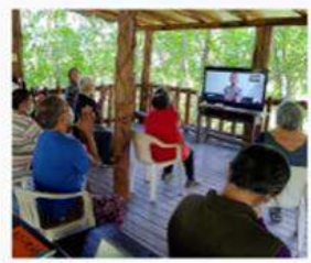
強化城鄉連結 促進都市、郊區與城鄉之間的社經與環境的正向連結。