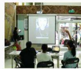
創造就業機會 增加健康導師、專家等證書的就業機會。