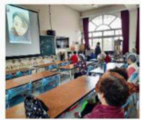
確保弱勢族群享有課程資源 偏鄉關懷據點可獲得與都市地區相同的課程資源。