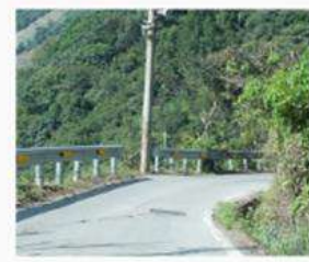
減少碳排放量 數位科技減少課程辦理的課程碳排放量。