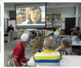
減少醫療不平等 長輩增加健康知識，照顧者可提供相關知識，減少照顧壓力。