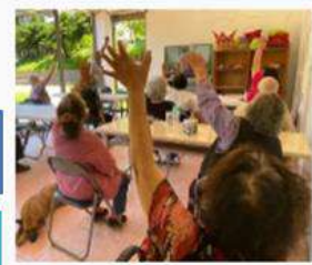
促進全人健康生活 長輩參與健康促進課程，提升健康意識，維持良好健康，延緩退化。