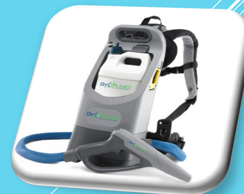
靜電消毒噴霧機管線