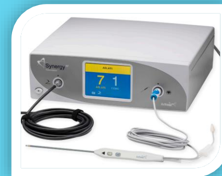
高頻電燒手術刀醫療線