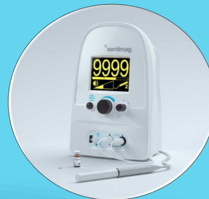
乳腺癌腫瘤切除設備用線