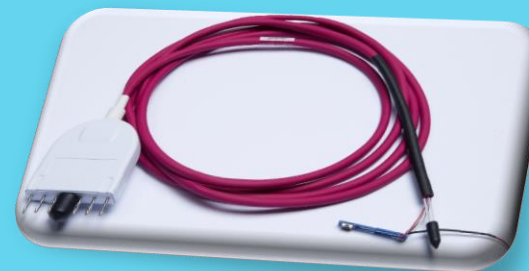
等離子手術刀醫療線