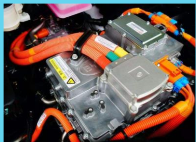
電動汽車高壓線束